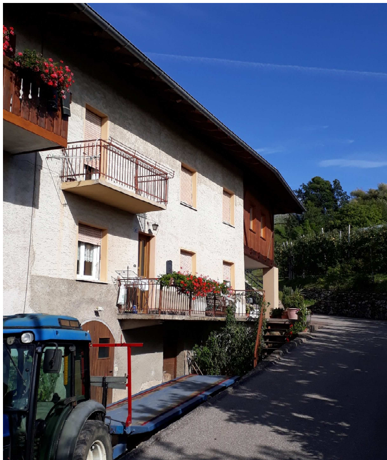
Vista da ovest