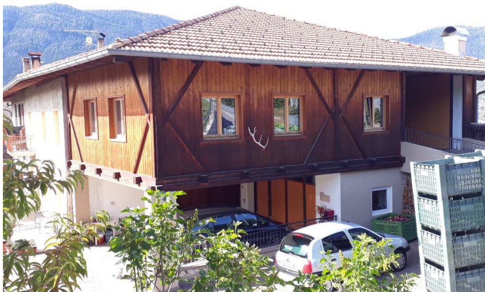
Vista da sud